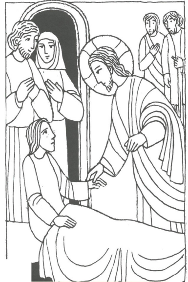
Jesus heilte viele Mk 1, 7 - 11