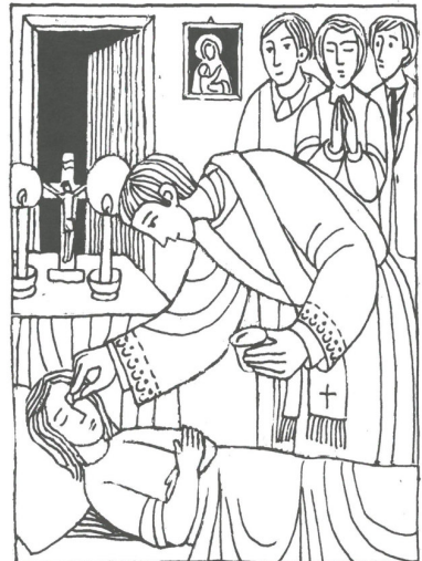
5. Sonntag im Jahreskreis B

Jesus Christus: Licht, der alle Völker erleuchten will.