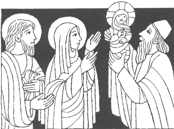
2. Februar - Darstellung des Herrn im Tempel - Maria Lichtmess