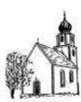
St. Nikolaus Rammerberg

Katholisches Pfarramt - Tel. 09184/937 - Fax 09184/809319