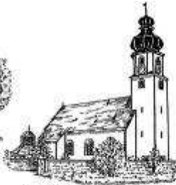
St. Mariä Verkündigung Günching