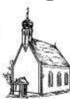
St. Ägidius Hanenzholen