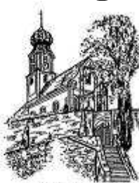
St. Martin Lengenfeld