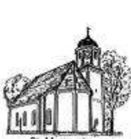
St. Margareta Deusmauer