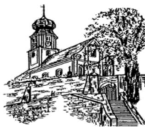
St. Martin Lengenfeld