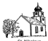
St. Nikolaus Rammersberg