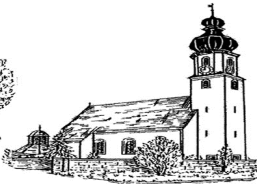
St. Mariä Verkündigung Günching