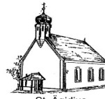
St. Agidius Harenzhofen